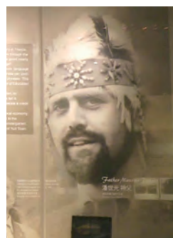
▲潘世光神父的老照片是此次特展的緣起。