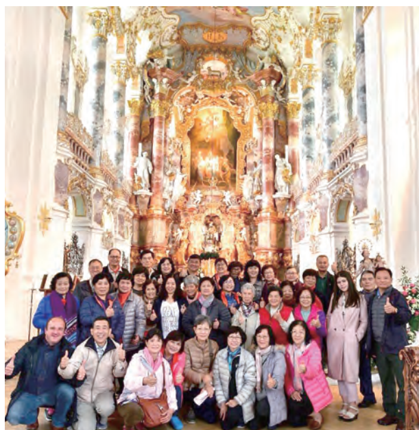
▲參訪世界文化遺產——德國慕尼黑維斯教堂

途中，謝神父一再強調，生活中多存感恩，如一再抱怨，怎能聽到天主的聲音？朝聖期間，參與彌撒前至少半小時，謝神父要求大家靜默，將平靜沈澱留給自己與天主。感謝謝神父與副團長率領工作團隊妥善規畫安排，憑藉專業實力與堅定信仰，加上天主的祝福，讓每位團員展現合作與謹慎，日有長進，身心皆得屬靈滋養。