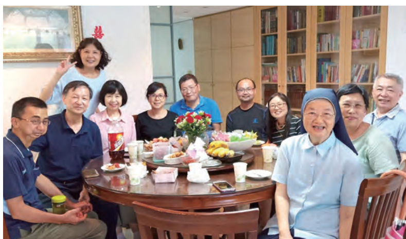
▲探訪湯靜蓮修女與第1屆Choice分享夫婦、資深選擇人。

每一座山都是生命中最重要的挑戰。兩天一夜，9座山、9個挑戰，帶領我們透視自己的內心，更了解生命中的每一步腳印。選擇週末成長營開啟我們內心的枷鎖，讓我們能自信的選擇理想中最好的選擇。