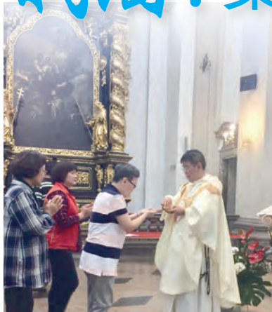
▲捷克布拉格聖母戰勝大教堂舉行彌撒