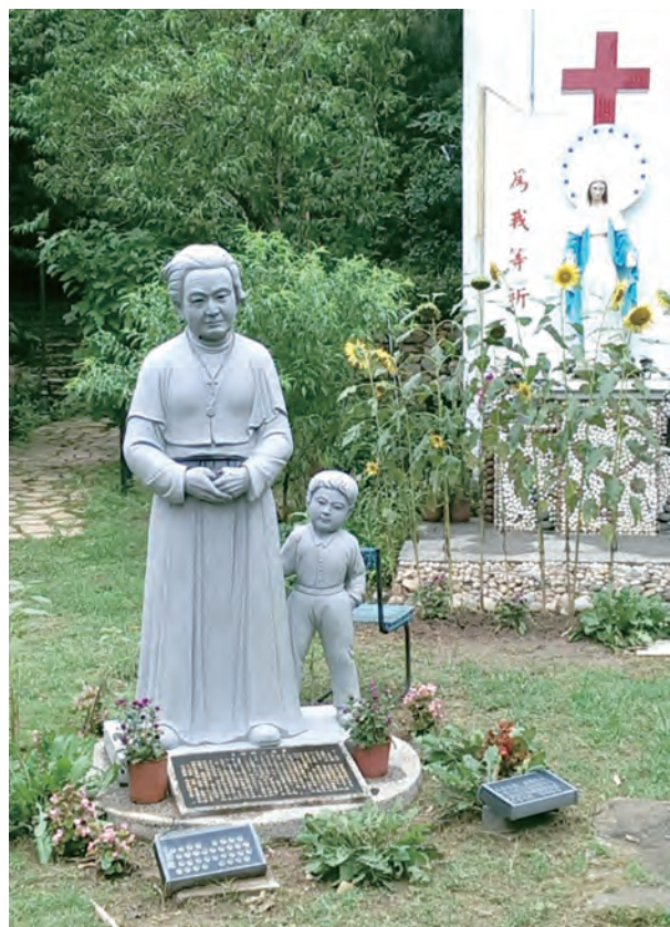
▲石仁愛姆媽的愛，永留馬祖人心中。

感恩讚頌！上主對我們每一位的愛，真是奇妙！北區天主教學校宗輔教師每月有定期會議，這次我們跟著洪山川總主教腳步，來到馬祖。6月22日至24日的3天兩夜，我們一行人在旅途中看見、聽見、遇見了活生生的天主。每一位都個別地經驗到天主深深的美妙愛！衷心感謝洪總主教謙卑地帶領我們去經驗這豐富的靈修之旅！謹以幾位夥伴的寶貴感恩體驗，代表我們全體的感恩，也願藉此向大家傳報主福音——祂真是我們奇妙的救主！上主的愛真的很奇妙！