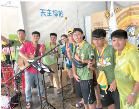
▲來自新竹教區磐石中學的童軍們上台一起帶動唱