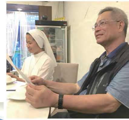
▲洪山川總主教喜悅地聆聽我們朗誦祝福的藏頭詩。 ▼在南竿遊客中心園區及海邊，都有了豐富的體驗。