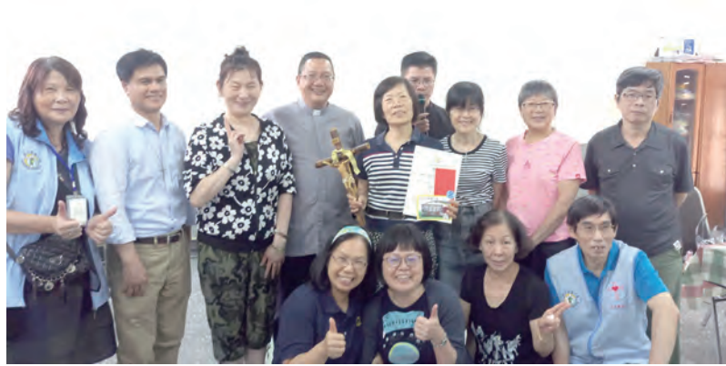
▲新竹耶穌聖心堂勇奪冠軍的勇士們