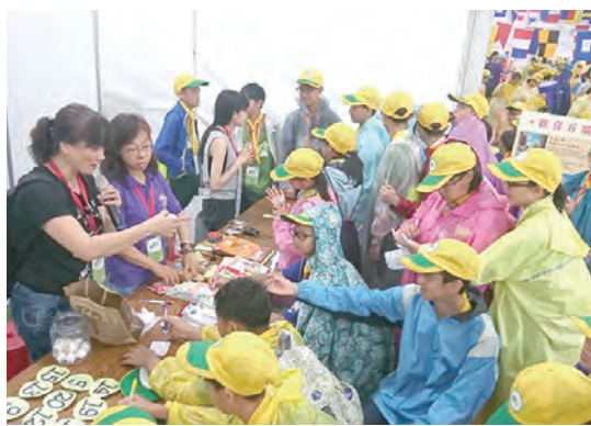
▲復興天主堂的教友用玩賓果方式與童軍們同樂