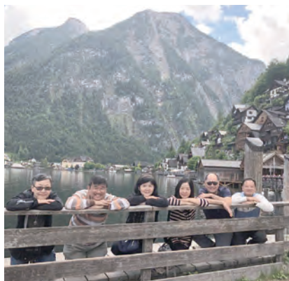
▲奧地利哈爾施塔特湖畔讚美天主的化工