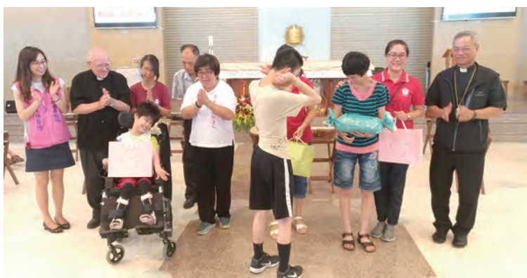
▲同心歡慶聖嘉民啟智中心畢業典禮