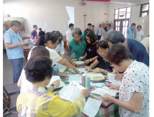
▲每支參賽隊伍分工合作，專心答題。