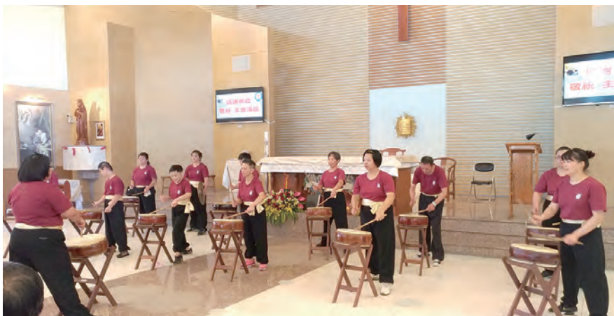
▲聖嘉民啟智中心師生太鼓隊賣力演出，活力非凡。