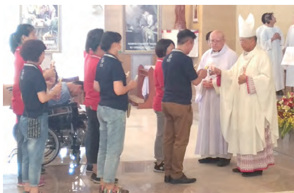
▲傳光禮促進聖嘉民大家庭工作夥伴們的動力與熱誠

位於宜蘭三星鄉的聖嘉民家園7月13日團聚一堂，從上午10時開始，歡慶「聖嘉民啟智中心」31周年慶暨畢業典禮、「聖嘉民長期照護中心」9周年慶以及「聖嘉民天主堂」4周年堂慶。聖嘉民院慶感恩祭典由總主教洪山川主禮，台灣靈醫會長呂若瑟神父與第十鐸區高國卿神父及靈醫會安恆立神父等共祭，另外由啟智中心學員們一起擔任輔祭工作，是一場特別溫馨、愉快與感恩的院慶活動。