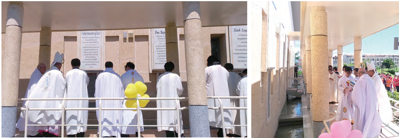
▲洪山川總主教與靈醫會神父們共同祝聖各國語言的〈天主經〉石碑，象徵各族群合一在天主「愛的家園」內。