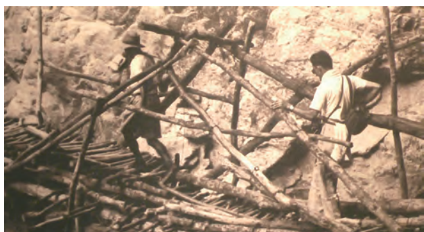
▲《玉里的法國爸爸特展》讓人感受神父們跨國的愛與關懷。

刻正於台中科博館展出的《玉里的法國爸爸特展》，介紹多位來自法國的牧者，從光復初期到花蓮，透過傳教的過程，將西方的物資、醫療與教育帶入，默默的照顧偏鄉資源分配不到的地方。透過老照片的陳述，讓人看到因著這些法國牧者的耕耘，成就了如今的玉里風華，寫著東台灣的發展史。這群神父的奉獻與典範，是法國的驕傲。科博館以此策畫特展，期待大眾透過特展感受跨國的愛與關懷。