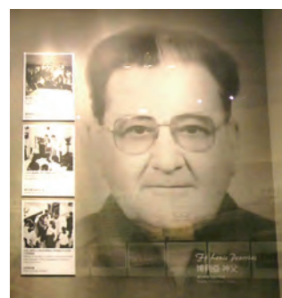
▲博利亞神父以愛震撼阿美族人的靈魂。