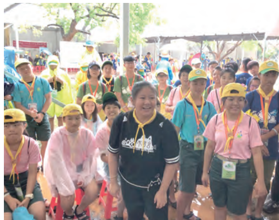
▲來自各地的童軍們跟著音樂旋律開心共鳴