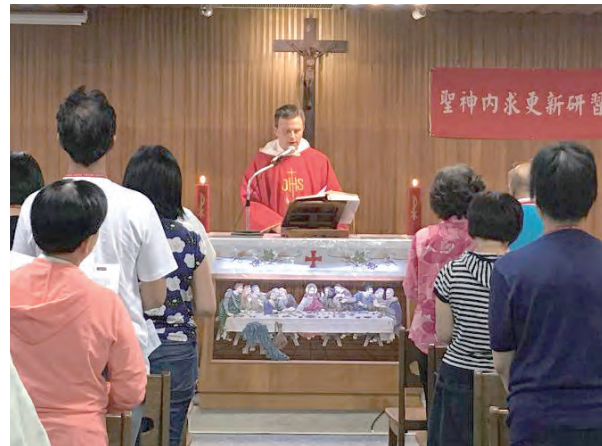
▲台北同禱會於板橋聖母聖心懷仁天主堂舉行感恩聖祭

會中發現還是有教友確實做過一些迷信的行為，如算命和到廟拜偶像的行為，而且這些舉動，已經在自己的生活中產生了不好的果實，並影響到自己的日常生活，遺憾的是，當事人居然不知道，自己生活中的苦毒是來自這些禍源。在覆手祈禱中聖神藉著圖像，傳達了各種不同的信息，也經受被祈禱者所承認與證實。並在經過醫治祈禱後，這些被祈禱者真的，感受到來自天主喜樂與平安。但這些喜樂平安，能在生活中繼續多久，端看自己能否活出好的靈命而定，就像一條水溝被清乾淨，不是永遠不會再有問題了一樣，當然，需要不斷努力維護。這也是為何有些參加同禱會後，有一些教友之所以會