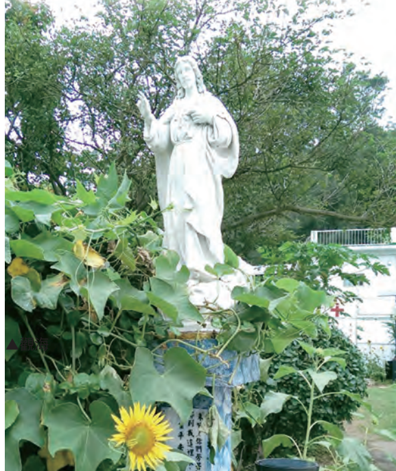
▲南竿天主堂的耶穌聖心，恆久守護著馬祖。