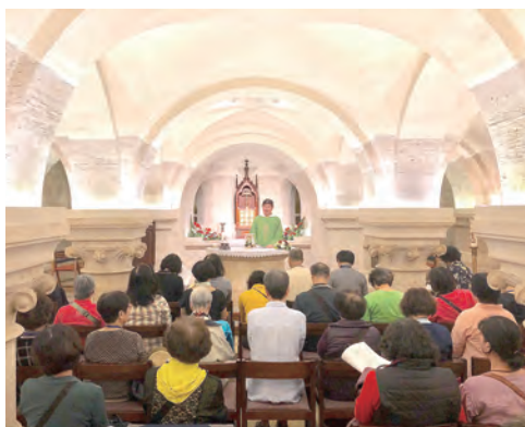
▲匈牙利布達佩斯馬加什教堂內溫馨的感恩聖祭