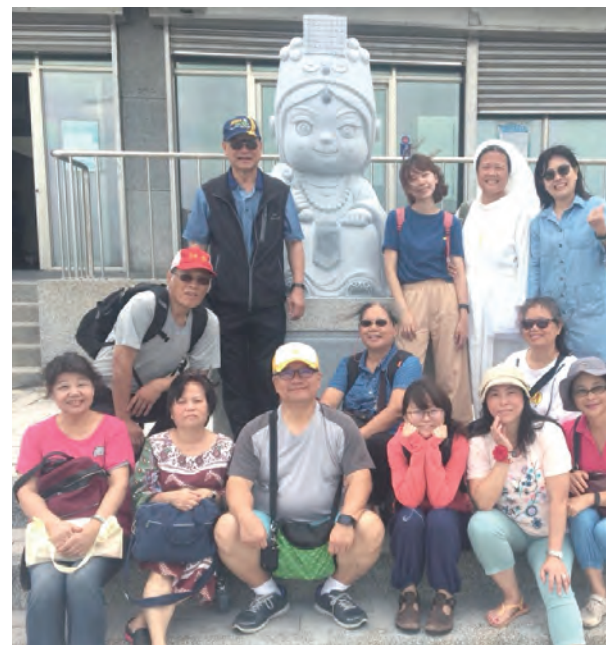
▲難忘馬祖北竿的美麗地景與豐富人文

在這段旅程中，要感謝的人太多，所以就感謝天主吧！感謝天主給予我們這樣的機會，能夠在美麗的馬祖列島遇見祂；感謝天主在旅程中為我們安排的每一位天使，讓我們在他們身上看見天主的樣貌；感謝天主讓我們在繁忙的工作中，有一段充電的時光，當我們再次回到工作崗位，更能幫助我們的學生在生活中經驗天主，也感受到天主滿滿的愛。