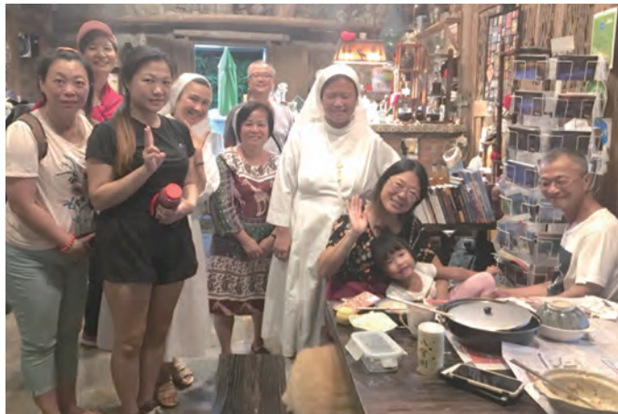
▲拜訪海邊教友的家

馬祖，是一個民間信仰濃厚的地方，在那裡傳教需要更多的耐心。這幾年在馬祖的活動中最讓我感動的是：雖然當地人不一定願意受洗成為天主教徒，但只要在路上見到神父與修女都非常開心。可見在當地服務的神職人員對於當地人多麼的用心，無私的付出，盡心盡力的照顧馬祖