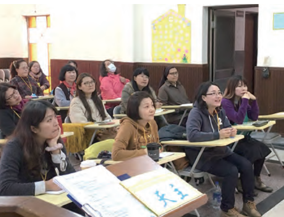
▲主日學師資培訓班學員上課認真

在多次禱告下，我終於鼓起勇氣報名參加培訓課程。原以為這是一堂老師教授我們如何在主日學中去教小孩背誦《聖經》、推動天主教教理的課程。結果我錯了，發現我得到更重要的啟發，